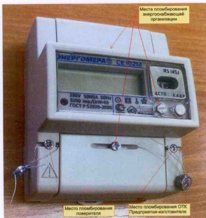
Рисунок 2 – Общий вид счетчика CE102M R5