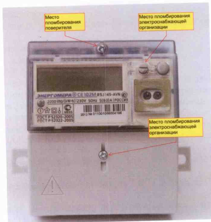
Рисунок 4 – Общий вид счетчика CE102M R5.1

Полный список форматов вывода измеренных, вычисленных и накопленных параметров приведен в таблице 1.