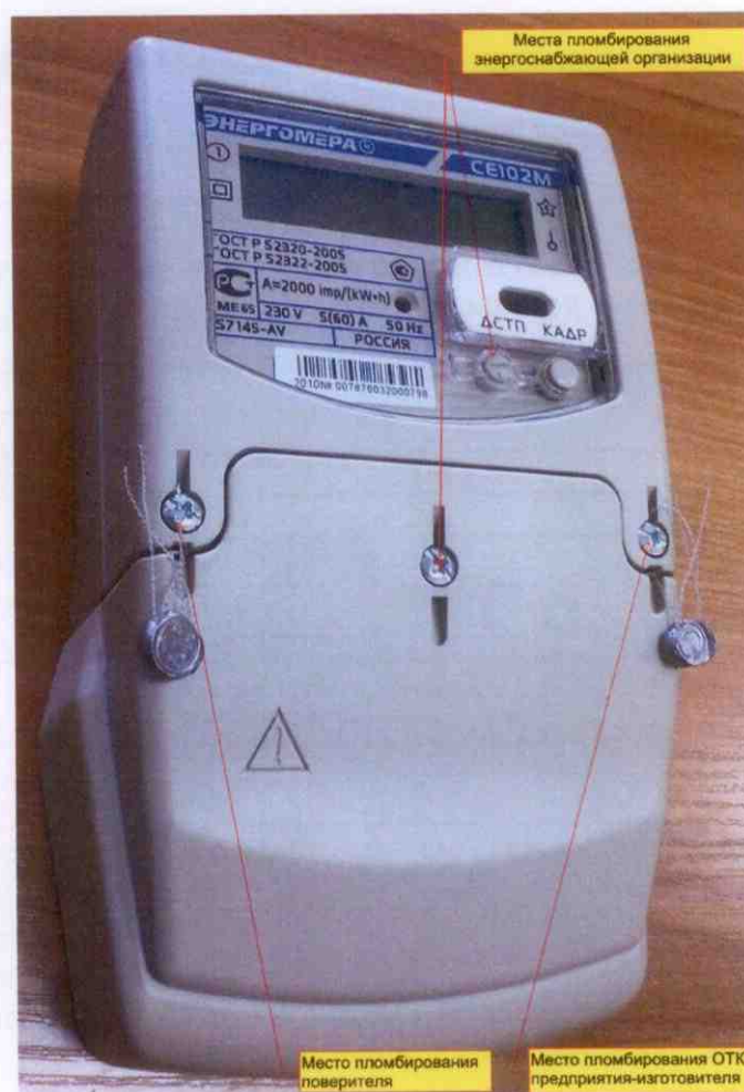
Рисунок 3 – Общий вид счетчика CE102M S7